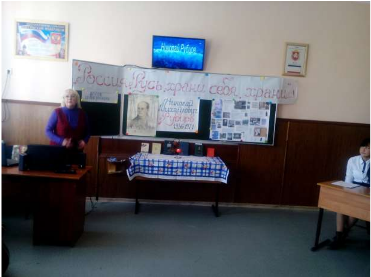
Активные участники Литературной гостиной