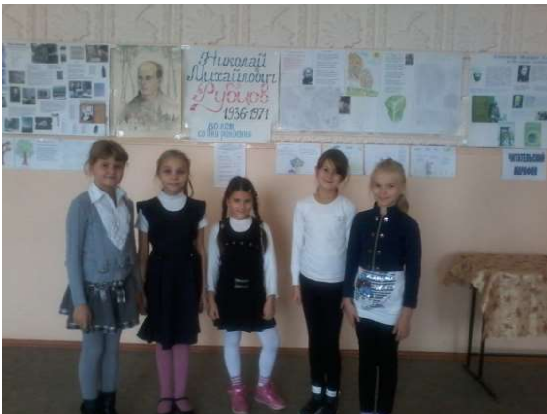
Автор рисунков на стихи Н.М. Рубцова – Пожарня Эльвина